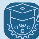
Distritus di Skola